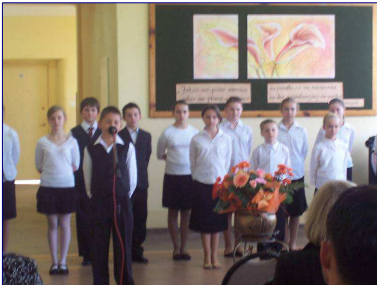
Fot 1. Uczniowie klasy V „a”, V „b” i VI „a” podczas uroczystej akademii